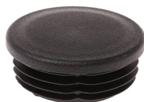
Copertura superficie palo